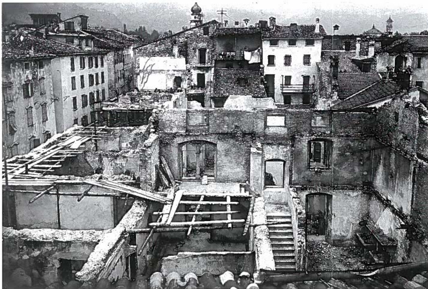
Riva del Garda Case Lucciolì, attuale piazza delle Erbe [MGR 29/11]